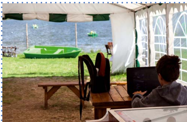
Ośrodek Wypoczynkowy Spizarni Kujawskiej nad Jeziorem Ostrowąs