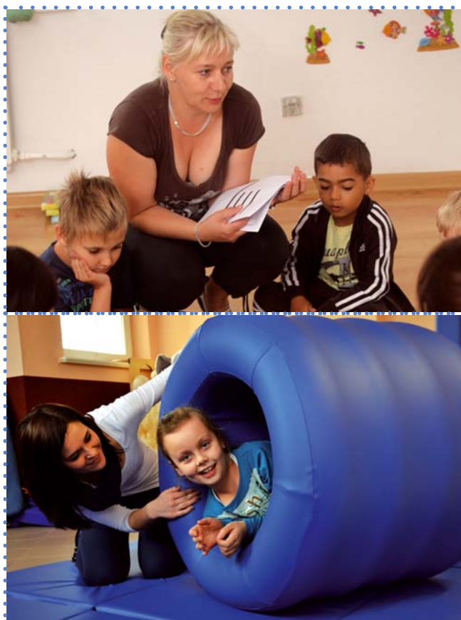
Zajęcia z dziećmi w gabinecie psychologiczno-terapeutycznym w Tucholi, prowadzonym przez spółdzielnię socjalną Progres.

nym celem było stworzenie ścieżki umożliwiającej niepełnosprawnym uczestnikom WTZ wejście na