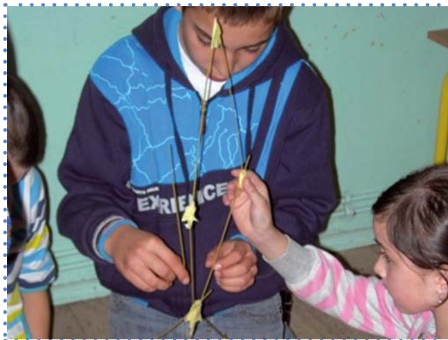
Zajęcia w Szkole Podstawowej w Cieszewie, k/Drobinia, pow. plocki, woj. mazowieckie.

Współpracowaliśmy z Uniwersytetem Jagiellońskim, z Instytutem Spraw Publicznych. Byliśmy Partnerami w ciekawym projekcie „Zmiany organizacyjne w instytucjach rynku pracy”. Bardzo dużo się nauczyliśmy, ale też mam świadomość, że i my przekazaliśmy innym całkiem sporo wiedzy, umiejętności, kompetencji.