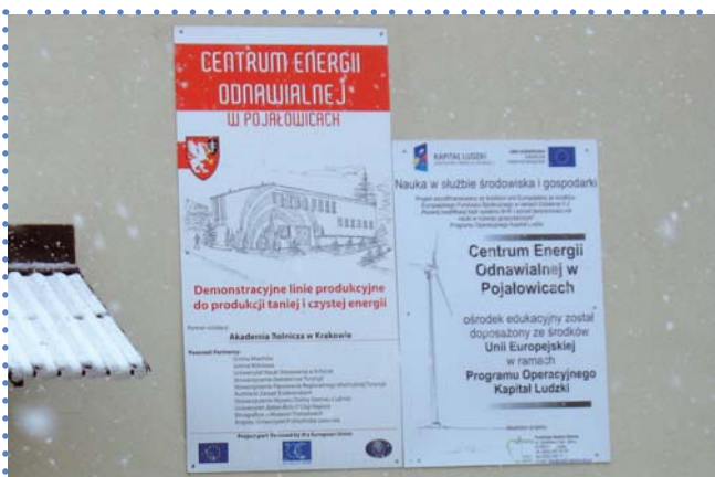
Centrum Energii Odnawialnej w Pojałowicach pod Miechowem, woj. małopolskie

To był też czas kiedy Fundacja zaczęła startować do różnych konkursów – starać się o dotacje, np. udało się zdobywać granty w Fundacji Batoiego, Fundacji Rozwoju Demokracji Lokalnej, LGPP (Local Government Partnership Program), FDPA (Fundacja na rzecz Rozwoju Polskiego Rolnictwa). W konsorcjum z firmą duńską, otrzymywaliśmy środki z Polsko-Amerykańskiej Fundacji Wolności. Zaczynaliśmy od bardzo małych kwot po to, by po wielu latach, z sukcesem większym lub mniejszym, korzystać ze środków unijnych. Zawsze jednak staraliśmy się w pozyskiwaniu środków kierować się przede wszystkim celami, jakie sobie stawialiśmy, i nie uzależniać się zbyt- nio od zewnętrznych źródeł finansowania.