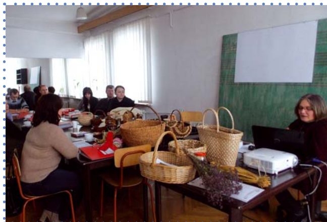
Szkolenie w Opatowie (styczeń 2013 r.)

Dodatkowo z działalności naszego Ośrodka, realizującego projekty informacyjne i szkoleniowo-doradcze w zakresie rozwoju przedsiębiorczości na terenach wiejskich, wynika, że mieszkańcy wsi, aby różnicować źródła swoich dochodów, potrzebują przede wszystkim bezpośredniego wsparcia finansowego, połączonego z pomocą doradczo-szkoleniową na temat zasad prowadzenia działalności gospodarczej. W przekonaniu pracowników Ośrodka te dwa rodzaje działań łącznie są najbardziej efektywne przy wspieraniu wielofunkcyjnego i zrównoważonego rozwoju obszarów wiejskich.