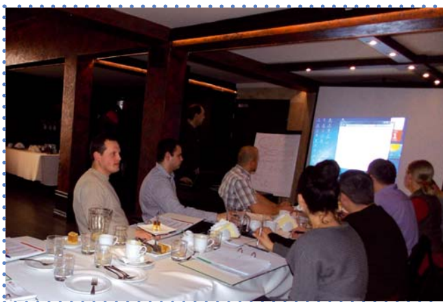
Szkolenie w Ostrowcu Świętokrzyskim (styczeń 2013 r.)

Na podstawie ponaddwudziestoletniego doświadczenia Ośrodka Promowania Przedsiębiorczości w Sandomierzu w zakresie wspierania powstawania firm na obszarach wiejskich, możemy stwierdzić, że podstawowym czynnikiem mobilizującym mieszkańców obszarów wiejskich do tworzenia przedsiębiorstw jest potrzeba przeciwdziałania spadkom dochodów w gospodarstwach