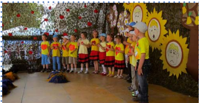
Występy dzieci z punktu przedszkolnego w Drobinie, pow. plocki, woj. mazowieckie.