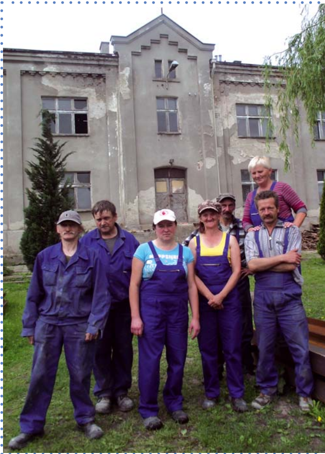
Ekipa remontowa Spółdzielni socjalnej Perspektywa na tle przyszłej hali produkcyjnej.

niu mienia typu obiekty-nieżytki na terenie gminy, tworząc na ich bazie miejsca rozwoju społecznego, kulturalnego i sportowego dla społeczności lokalnej.