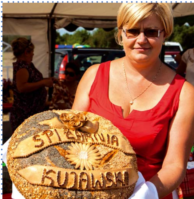
Prezentacja wypieków Spizarni Kujawskiej

smaczny obiad, a po południu miło spędzić czas, np. przy stole do „piłkarzyków”.