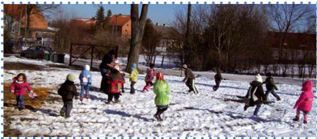
Dzieci z przedszkola w Kunkach, gm. Olsztynek, woj. warmińsko-mazurskie.

Skupiamy się głównie na programach edukacyjnych. Pracujemy w szkołach z uczniami, nauczycielami i rodzicami. Mnóstwo ciekawych zdarzeń, pomysłów. Poza zajęciami wyrównującymi niedobory edukacyjne, organizowaliśmy zajęcia z ciekawymi ludźmi, pikniki naukowe, wycieczki. Z nauczycielami i rodzicami prowadziliśmy warsztaty. Prowadziliśmy w latach 2010-2013 osiem punktów przedszkolnych. Było to „super” ciekawe doświadczenie, spotkaliśmy ciekawych ludzi, zatrudniliśmy nauczycieli z pasją, doświadczeniem. Czasami też bez doświadczenia, ale za to z pasją. Sześć z tych przedszkoli działa nadal, i to jest sukces naszej Fundacji i samorządów.