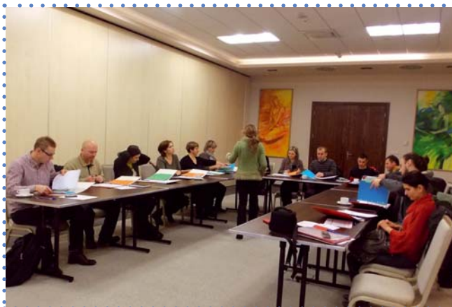
Szkolenie w Kielcach (grudzień 2012 r.)

W latach 2012 i 2013 Ośrodek organizował w ramach projektu „Góry Świętokrzyskie naszą przyszłością” szereg szkoleń pt. „Otwieramy własną firmę”, podczas których prowadzono zajęcia z zakładania działalności gospodarczej, wykorzystywania zasobów naturalnych regionu oraz zasad pisania biznes planu.